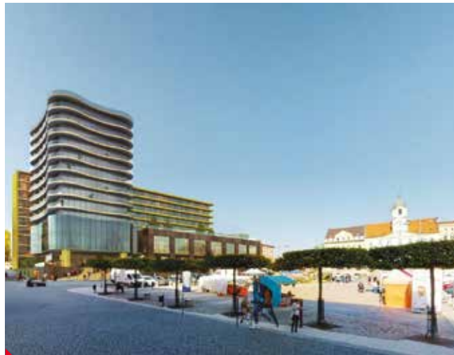
Vizualizace budoucího hotelu Hilton na teplickém náměstí Svobody.